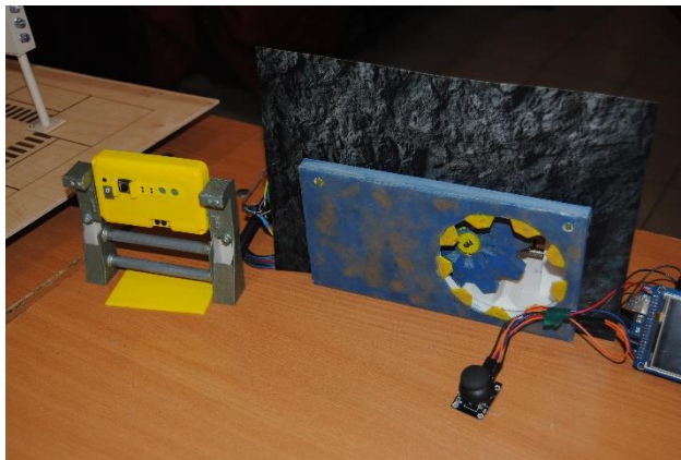
Дверь от бункера, изготовленная моими руками

Всё, как ни странно, начиналось с простейших механизмов: рычага, колеса и подобных. Древние люди додумались, что таким образом они могут облегчить себе физический труд, вдобавок и увеличив производительность. Я думаю, это послужило началу. Позже различные ученые выдвигали свои теории, открывали новые вещества, законы физики. Когда об их открытиях узнало человечество, в тот или иной промежуток времени эти технологии стали внедряться в повседневную жизнь, таким образом открывая новые изобретения. К примеру, то же радио, изобретённое Поповым, очень повлияло на жизнь наших предков. Представьте, теперь вам не нужно отправлять письма в привычном в тот момент формате. Отныне в мире изобретено передачи звука на расстояния при помощи радиоволн! Вот чудеса какие!