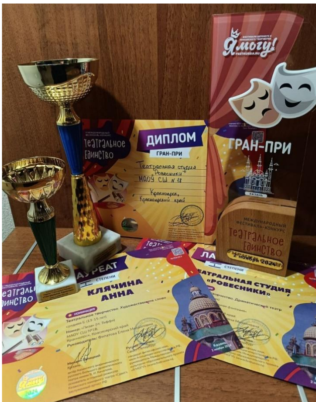
Награда нашла своих героев

Эта история берет начало в августе этого года. В это время я узнал, что наша театральная группа вместе с группой 7 класса собирается показать общую сценку для выездной поездки. Весьма сложной задачей является придумать какой именно спектакль поставить и восхитить жюри конкурса. Первой сложностью как раз и стало частые изменения сценария, плана действий, но после мы уже адаптировались к быстрым переменам. Ставим русалок – костюмы не вызывают восторга, пушкинские произведения? – маленькие еще, не можем раскрыть для зрителей то, чего хотим донести. «Золушка»? – сценарий недоработан. Путем проб и ошибок мы остановились на постановке «Свинопаса», но из-за глобальных перестановок оставался месяц, да и сроки поджимали. И сам фестиваль поменялся, ведь изначально мы хотели поехать в Минск, но решили выбрать Казань, тем более город, как оказалось, очень красивый. Нас было 12 человек. Но таким дружным и веселым сбором мы отрепетировали оставшийся месяц, а за пару дней собрали вещи и выдвинулись на поезде покорять Казань. Поездка прошла весело, а для меня особенно атмосферно, ведь до этого в поездах я не был. Было интересно изучать столь новую обстановку.