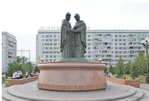
Пётр и Феврония Муромских

Также в нашем городе есть памятник великому писателю и поэту А. С. Пушкину. Он находится недалеко от остановки «Театр Пушкина» и представляет собой событие: Пушкин признаётся в любви Гончаровой. Этот памятник был открыт в июне 2008 года к 209 годовщине со дня рождения великого поэта и всё ещё стоит на своём месте.