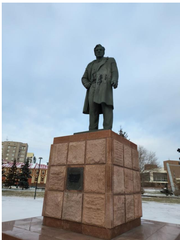
В. П. Астафьев